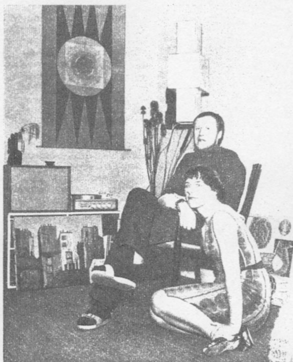
Kunstnerparret hygger sig i opholdsstuen. Ikke blot maleri og vægtæppe, men også lampen er hjemmelavet.