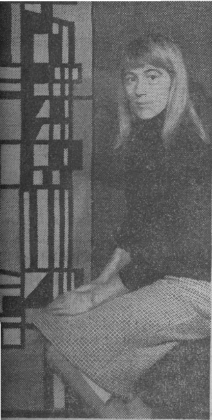
gruppens två "tæppepiger" bredvid en av sina bonader.