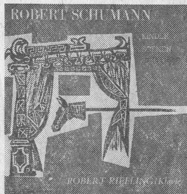
I gamle dage var pladehylstre triste og graa. Med longplayingpladerne er der opstaaet en ny teknik, som giver hylstrene et artistisk, ofte abstrakt præg. Her ses, hvordan man har givet hylstre til klassiske plader en kunstnerisk udformning.