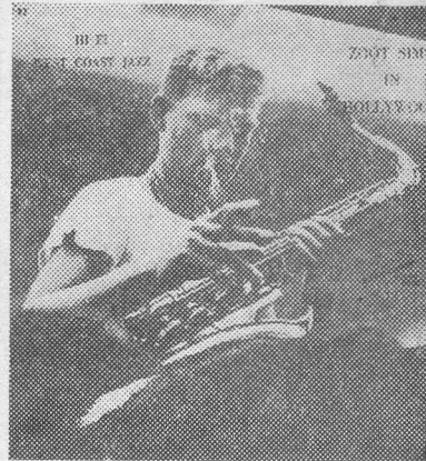
Det, der sælger bedst, er pladeomslag med fotografi af idolerne — og når det er jazz, må de gerne se lidt »hærgede« ud

Landet er ellers lovlig lille nok til at kunne give de unge opgaver — men grammofonindustrien har nu åbnet for en ny og dejlig tumleplads.